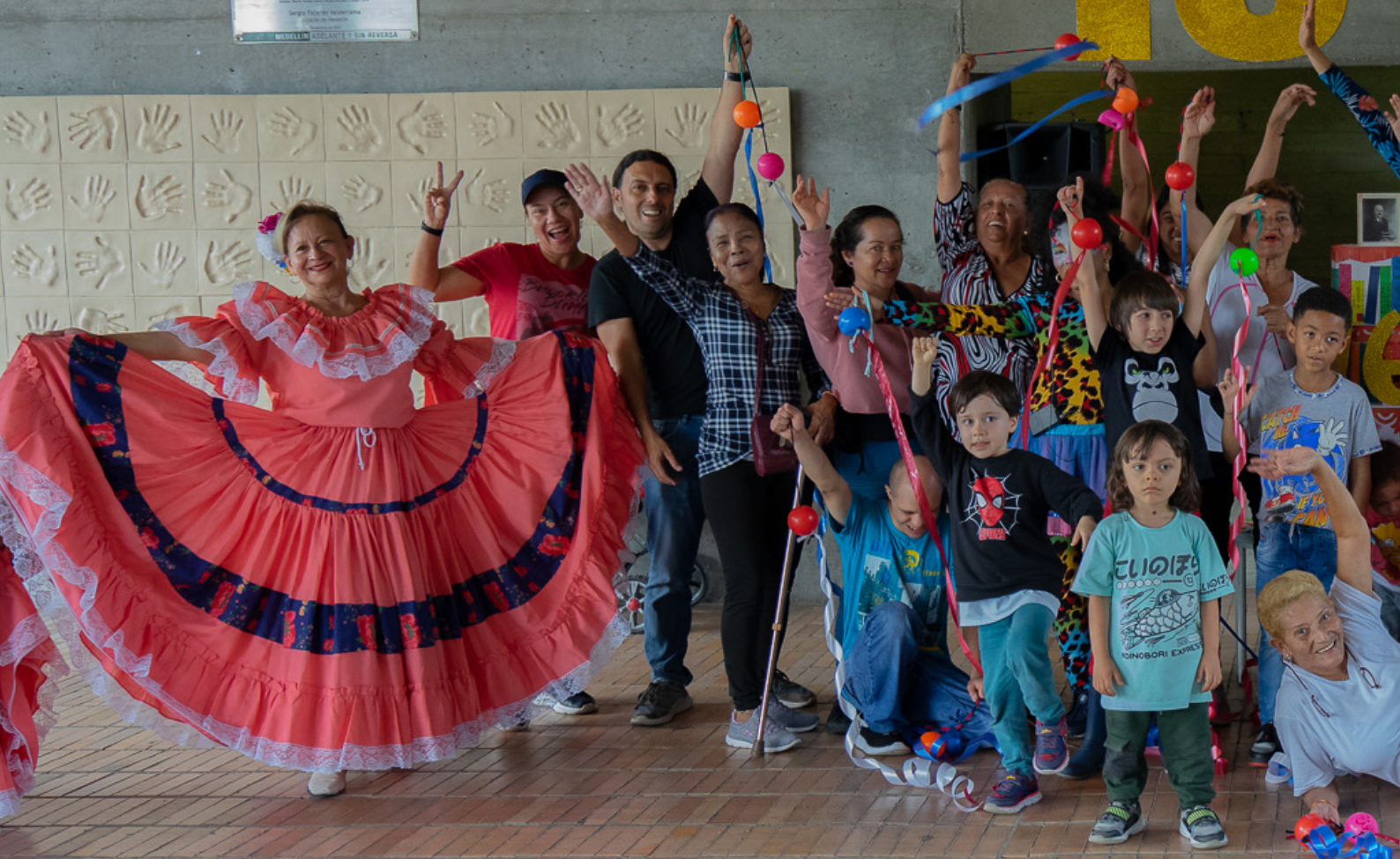
16.º Cumpleaños Parque Biblioteca Tomás Carrasquilla, La Quintana 10 de marzo de 2023