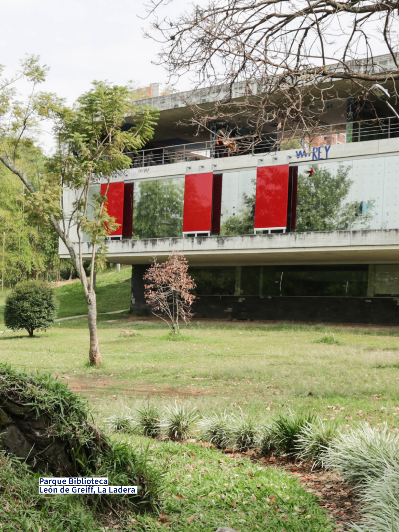
Parque Biblioteca León de Greiff, La Ladera